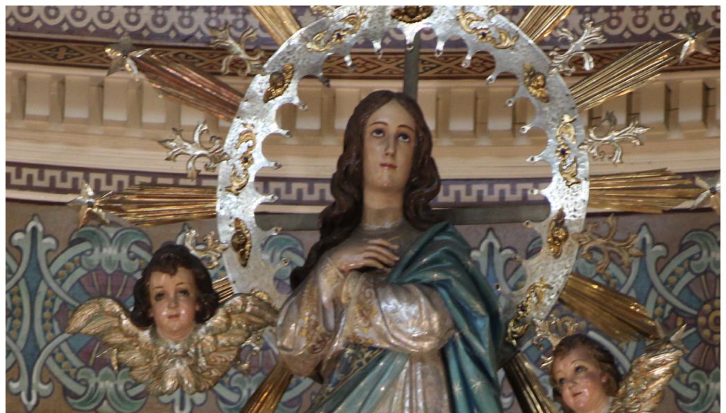
Foto de la portada: María Inmaculada, Catedral de San José, Costa Rica