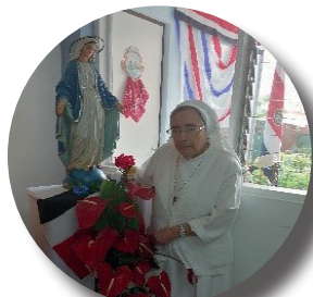
Por Sor Esther Calvo Murillo